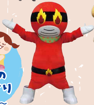
どんどん (市川三郷町)