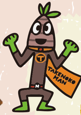
タケノコマン (南部町)