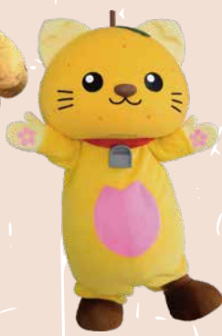
ゆずにゃん (富士川町)